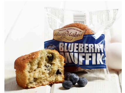
MUFFIN MYRTILLE (VENTE À L'UNITÉ)