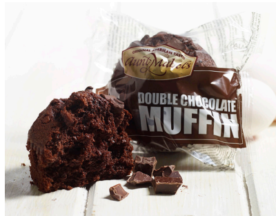
MUFFIN DOUBLE CHOCOLAT (VENTE À L'UNITÉ)