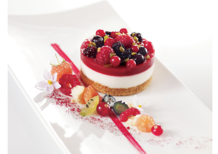
CHEESECAKE FRUITS ROUGES 16 PIÈCES