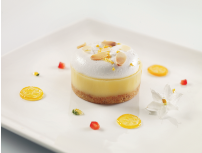
SABLÉ CITRON MERINGUÉ 16 PIÈCES