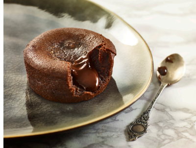
MOELLEUX AU CHOCOLAT 20 PIÈCES