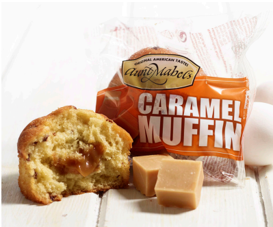
MUFFIN CARAMEL (VENTE À L'UNITÉ)